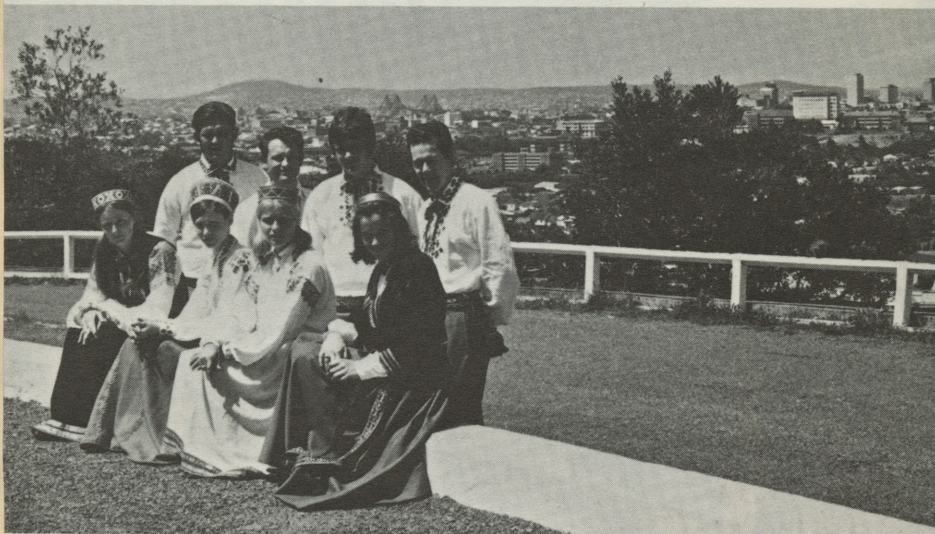
Jauniešu grupa Brisbanes ainavā