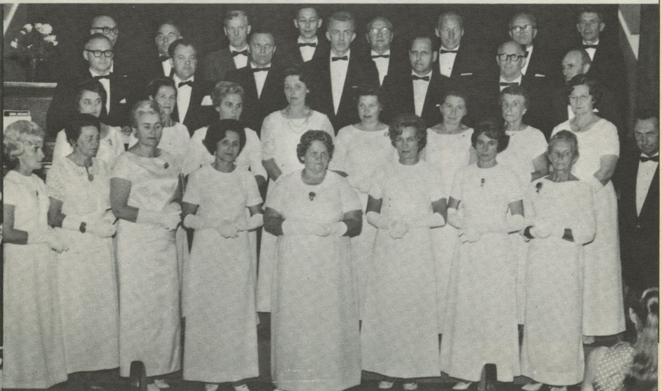
Brisbanes Latviešu biedrības jauktais koris