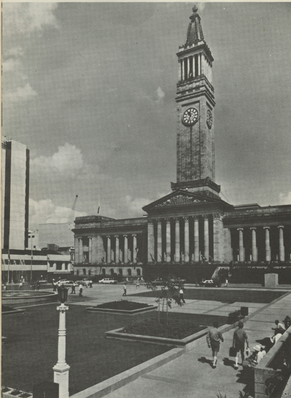
Brisbanes Pilsētas nams