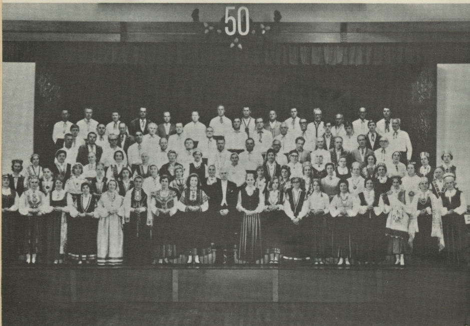
Adelaides Latviešu biedrības jauktais koris