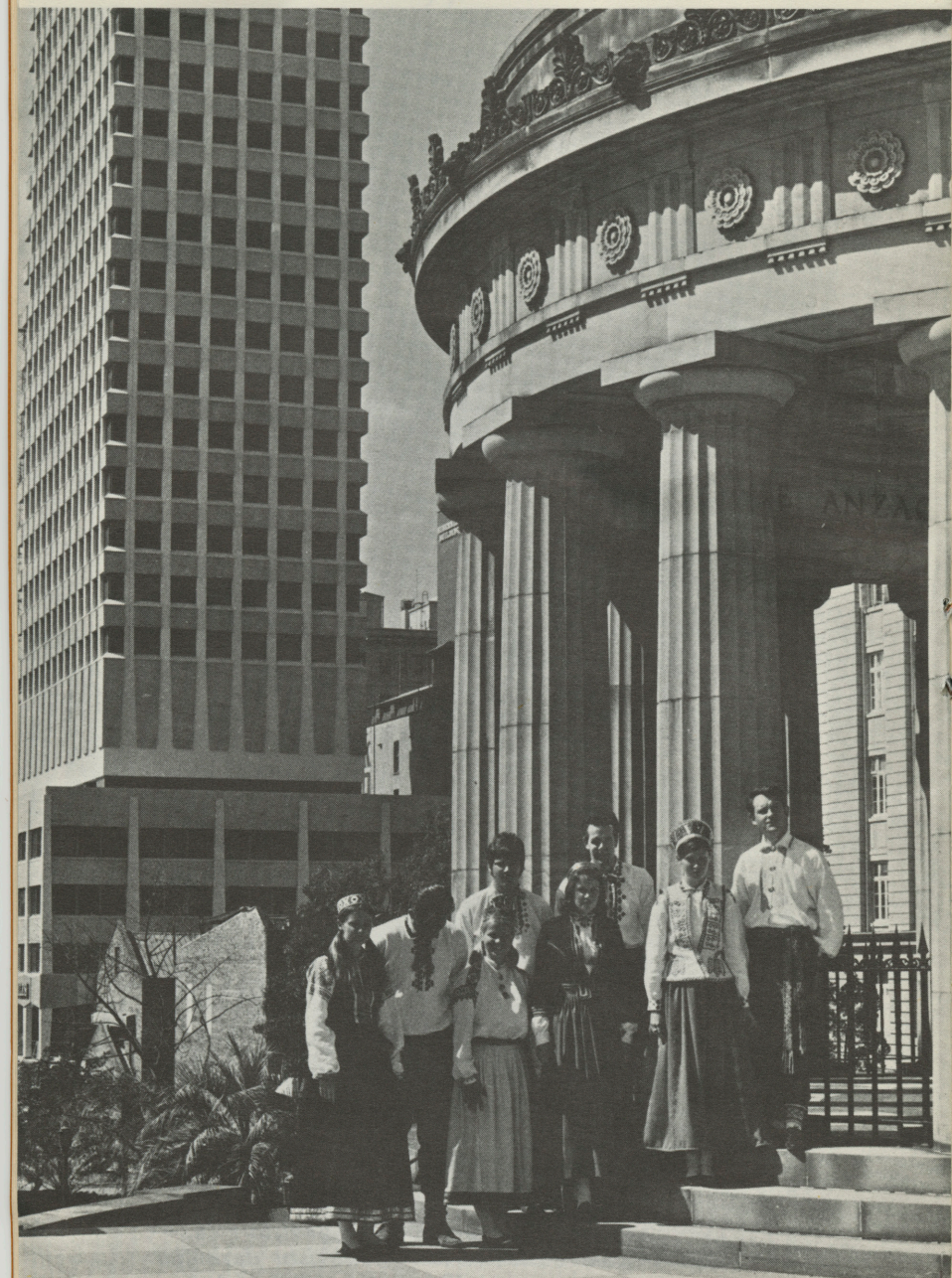
„Senatnes” dejotāju grupa