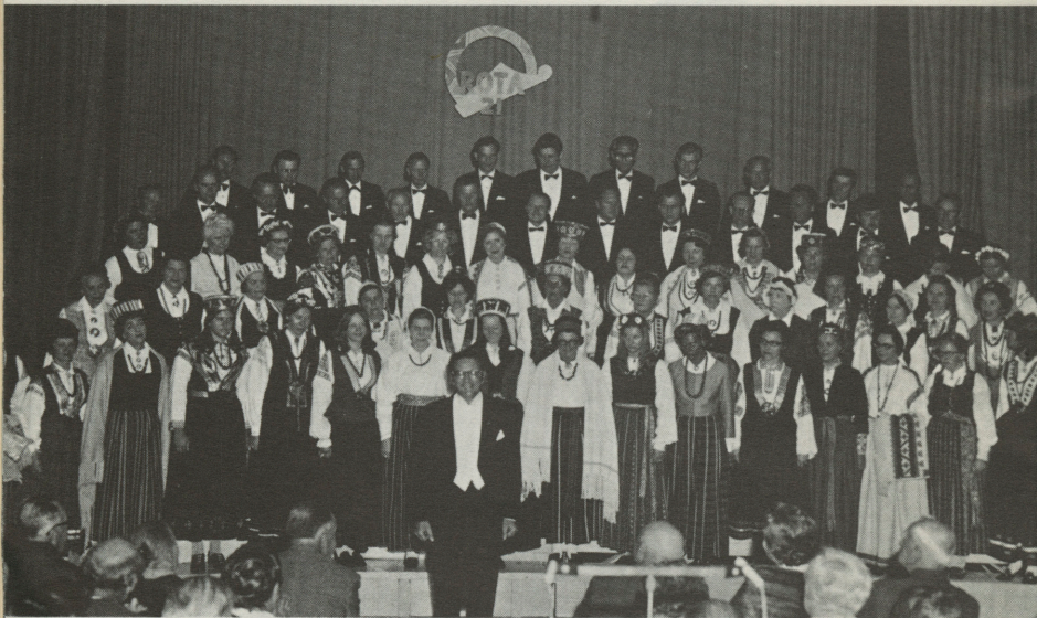
Melburnas Latviešu biedrības jauktais koris „Rota”