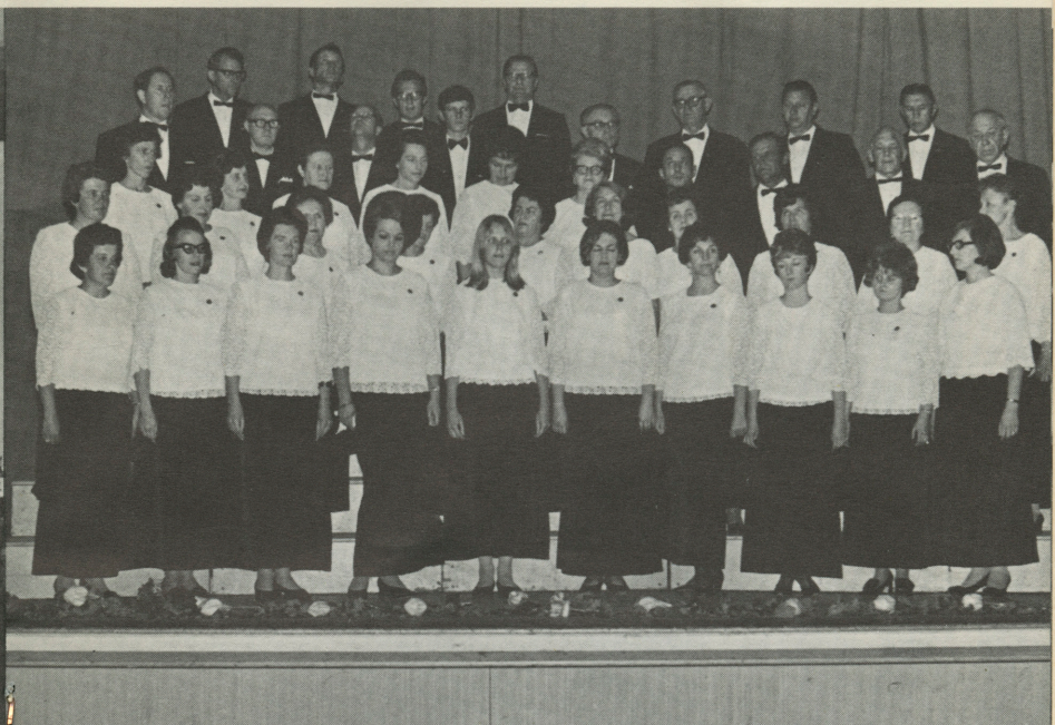
Sidnejas Latviešu biedrības jauktais koris