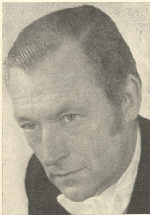
Mūsu diriģenti: Kārlis Nunavs